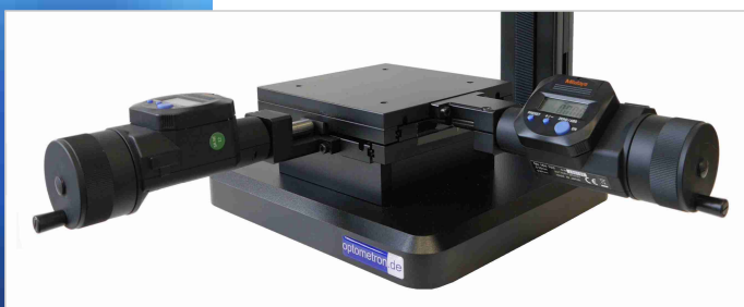
Optionaler Messtisch 50x50 mm mit digitalen Maßstäben (Auflösung 1,0 Mikrometer)